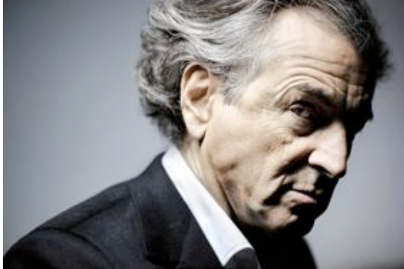
Olivier Roller, portrait de Bernard-Henri Lévy, 2010 100x150cm, Paris, Collection privée