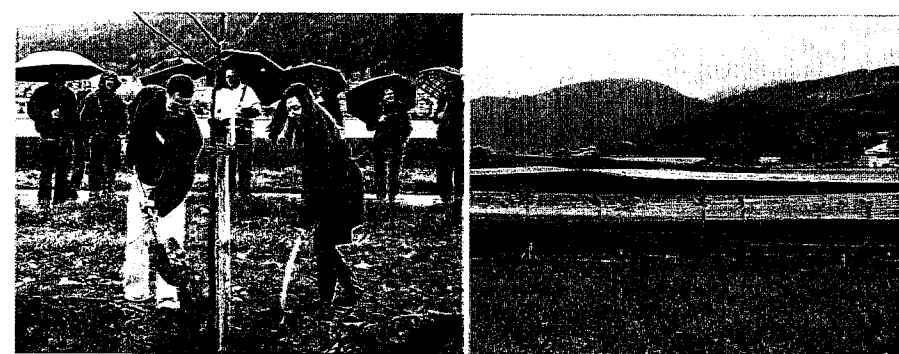
Inauguration d'une allée dans le Val-de-Ruz (NE), 2009 // Allée de noyers à Meinier (GE), 2007

Au printemps 2006, le FSP a lancé une campagne sur les allées. Une allée «habille et habite» les paysages, relie les biotopes et offre un abri aux mammifères, insectes et oiseaux. Le FSP a consacré 4,6 millions de francs à de nouvelles allées ce qui a permis de restituer 18'000 arbres, embellissant les paysages de plus de 200 communes dans 18 cantons, créant ainsi de précieux biotopes écologiques. L'engagement du FSP dans ce genre de projet continue dans le cadre de l'activité courante du FSP en faveur de la sauvegarde et de la revalorisation de paysages ruraux traditionnels proches de l'état naturel. Selon des règles légèrement modifiées, il soutiendra encore les plantations d'arbres dans le paysage rural dégagé, rangées d'arbres et allées marquantes, fruitiers de haute-tige, arbres champêtres, vergers, arbres individuels à des emplacements bien visibles.