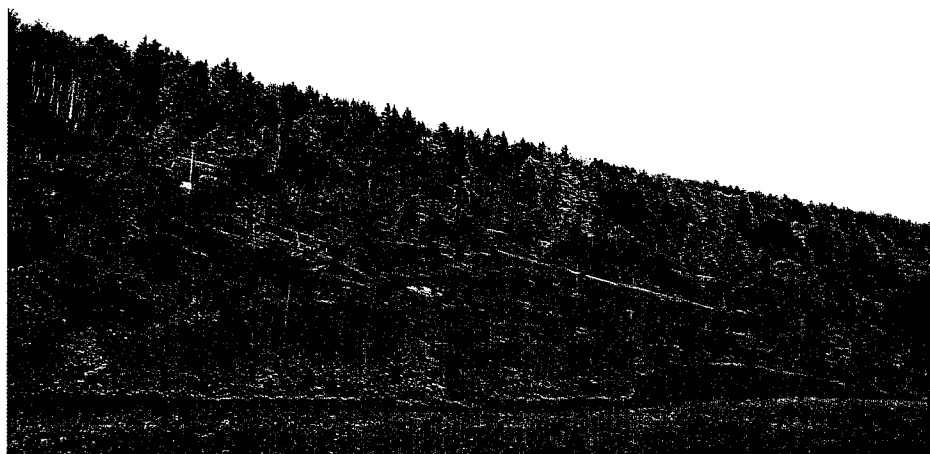
Pâturage remis en état à Glacenal (JU), Situation de départ // 11 janvier 2008 // 9 mai 2008 Ci-dessous: Chèvres bottées