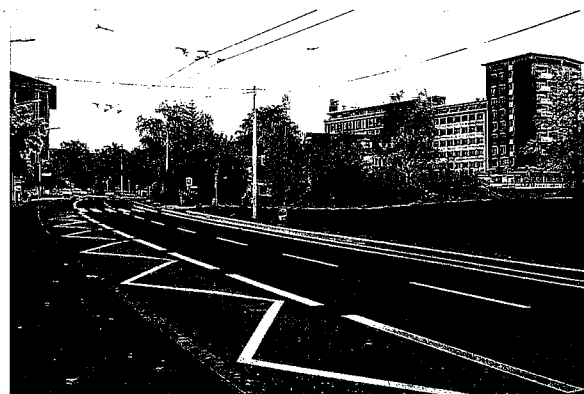
Ringstrasse, Blick nach Südosten auf das Zentrum.

In der ersten Projektphase 2005/06 wurde ein fotografisches Beobachtungskonzept für die Langzeitbeobachtung entwickelt und die er-